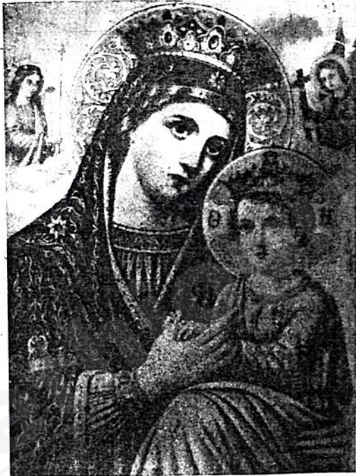
ደንገል ግርግር በሀዘብ ኩል ባለፉ

ብዬ ሰጋሁ ላሳጥረው እስኪ ከላይ ከታች ከራሱን ከግርጌ ቀንሚሷብ ኩት = ዳሩ ግን መላ ቢስ ጉማዳ ሳይሆን ጉራዳ ሆኖ አገኘሁት = “ለምን ትለኛለህ አፍንጫ ጉራዳ” በልተህ አታውቅም ወይ የሸን ኮራ አገዳ”