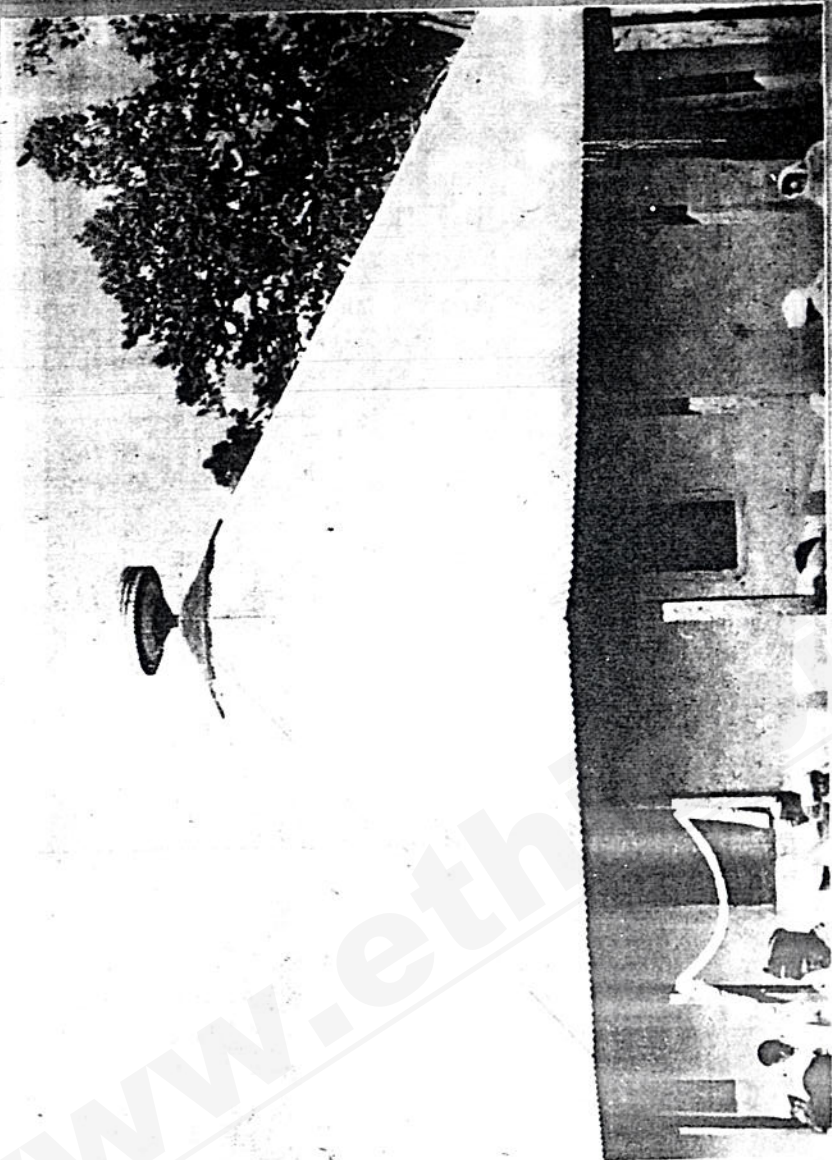
የግድታ ግርግም ቤቱ ክርስቲያን