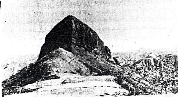
ገዳም የግንብት ተራራ

በመሻገር በሐማሴን አውራጃ ለንጭጭ ወደሚባለው ወረዳ በሐባ ላና ዴዳ እየተመለሱ በዚህም እካባቢ ከአቡነ ኤዎስጣቲዎስ ጋር ይገናኙ ነበር። እነዚህ ሁሉት ቅዱሳን አብረው ሲኖሩ እመቤታችን ቅድስት ድንግል ማርያም አቡነ እንድርያስንና አቡነ ኤዎስጣቲዎስን ጠርታ ሁለታችሁ መጥታችሁ በአሥመራ ባለውና በስሜ በታነጸው ቤተ ክርስቲያን እንድትቀድሱልኝ ብላ እንደነገረቻቸው የሕይወታቸውን ታሪክ የሚናገረው ገድላቸው ይመስክራል።