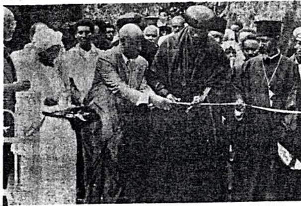
ቅዱስነታቸው በሙዚየም መገዘያ የተዘረጋውን ጥበባዊ በመቀስ ሲቆረጡ

ብዙ ወቅት አቡነ መርቆሌ ዎስ ፓትርያርክ ርእሰ ሊቃና ጳጳሳት ዘኢትዮጵያ አዲስ አበባ ከተማ በገነቱ ጽጌ ቅዱስ ጊዮርጊስ