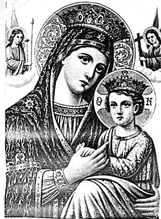
ድንግል ግርግም ምስል ፍቅር ወልደ